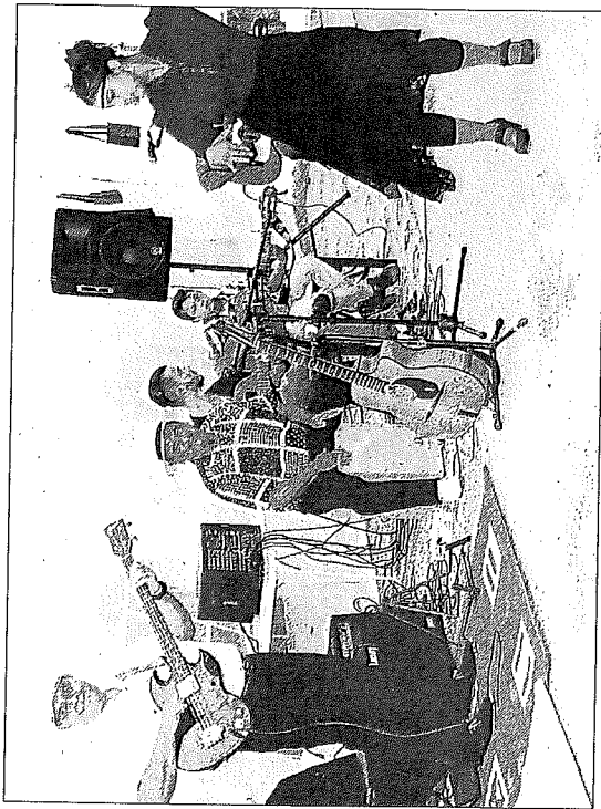
Le groupe Romano Swing a ponctué musicalement la grande vente de vendredi.

ronne, conseil départemental), à des donateurs et à des acheteurs qui cheminent depuis trois décennies avec Emmaüs.